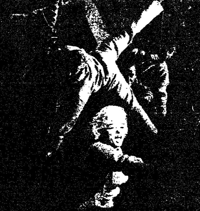
مارلين مونرو: حركة المرأة الخالدة في روضة الحظوة ... الصاعقة